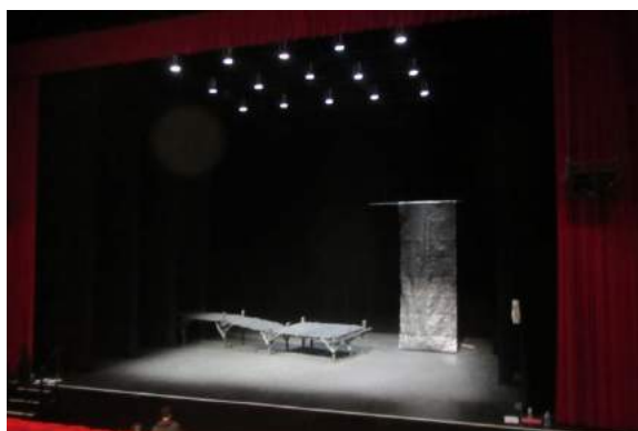
photos de répétitions