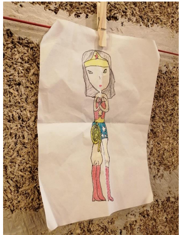
Les dessins de Mouche : Wonder Woman et des Cholitas Voladeras