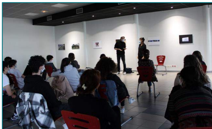
© D.R. photos Shell Shock , version brute