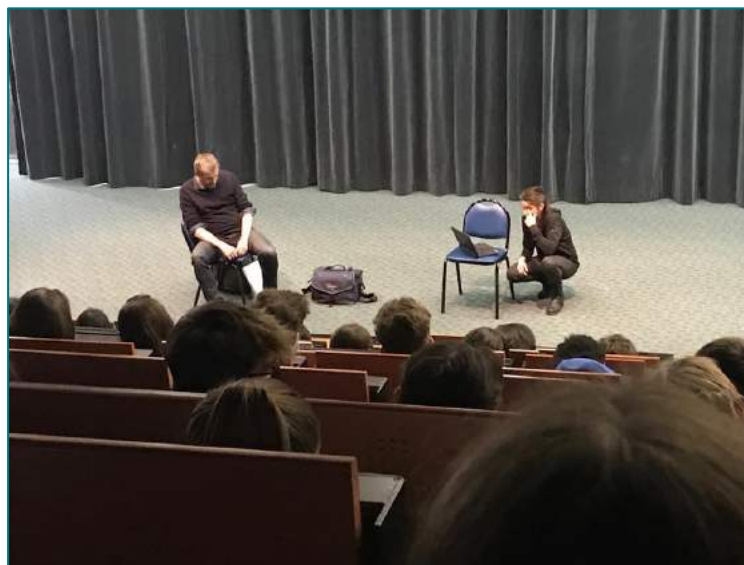
© D.R. photos Shell Shock , version brute