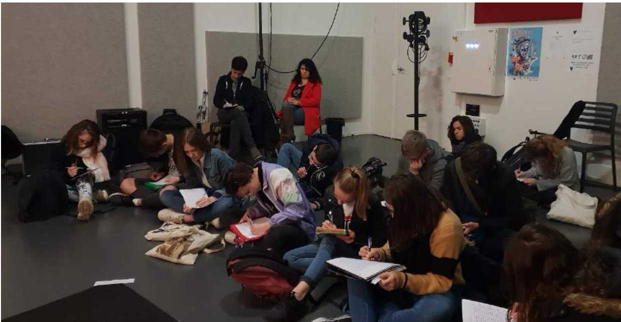
Atelier d'écriture « flash » lors de la résidence d'Evreux-Louviers / Avril 2019