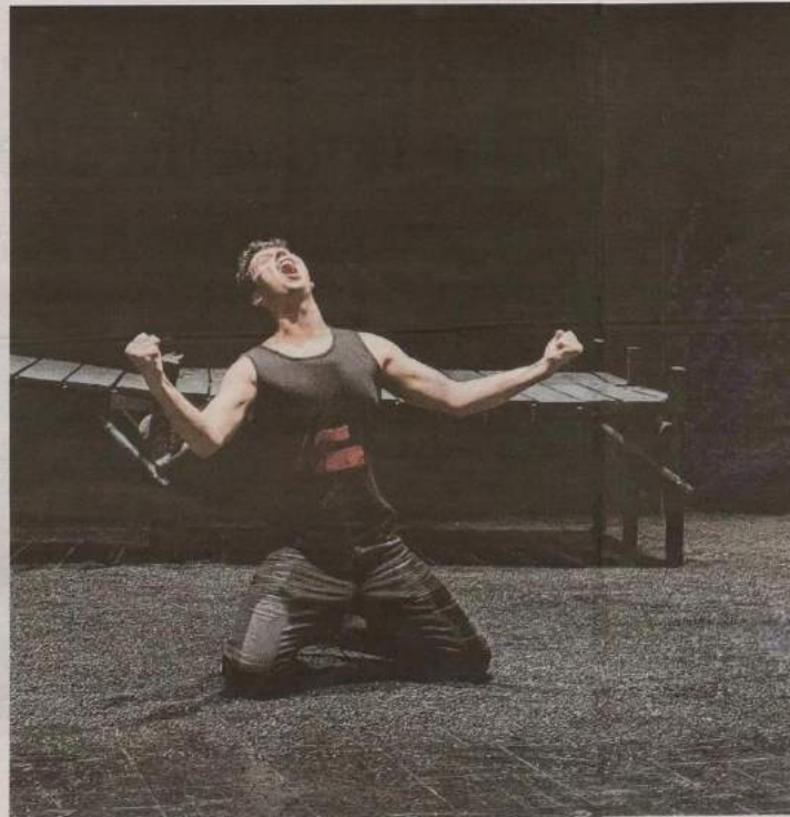
« Waynak » d'Annabelle Sergent, pour interroger la question « À qui vont les enfants en temps de guerre ? ». Crédits : l'art.

« Nous avons hâte de découvrir "Waynak", la nouvelle création d'Annabelle Sergent, de la Compagnie Loba d'Angers. Car c'est le fruit de deux ans de travail mené par l'artiste, qui a régulièrement